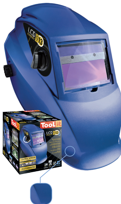
Livré avec un serre-tête